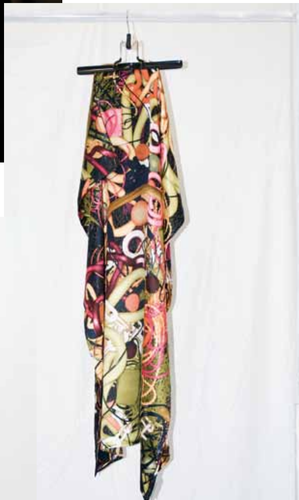
Sjaal en catwalklook uit de huidige wintercollectie.

Hoewel hij zijn label al in 2007 lanceerde, presenteerde hij deze zomer pas een eerste volwaardige collectie. Voordien maakte hij drie collecties, met uitsluitend felbeprinte zijden sjaals. Vorige winter was er een capsulecollectie met zwarte,