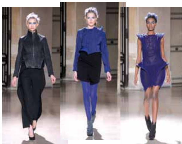
Astinten en kobaltblauw in een collectie rond de transformatie van objecten door hitte.